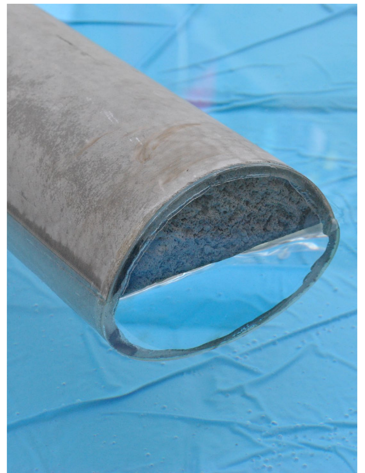
Integraal geschuimd beton is zo licht dat het blijft drijven